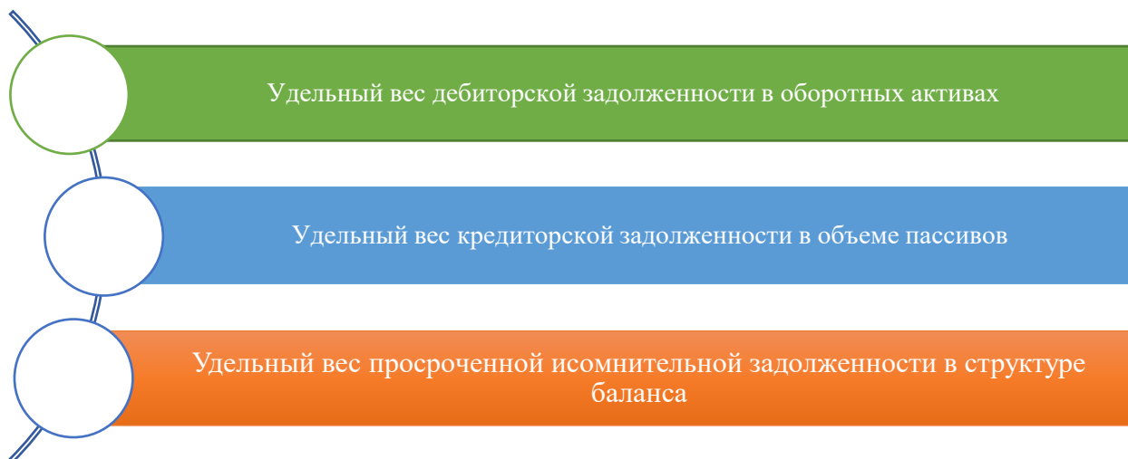
Рисунок 2. Показатели, необходимые в целях проведения анализа управления дебиторской и кредиторской задолженностью 2

По данным рисунка 1. можно отметить, что при анализе дебиторской и кредиторской задолженности используется: удельный вес дебиторской задолженности хозяйствующего субъекта в совокупном объеме текущих активов.